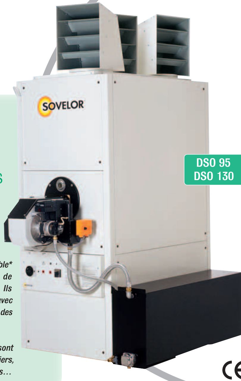
DSO 95 DSO 130